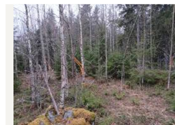
Koillisraja on kasvanut umpeen