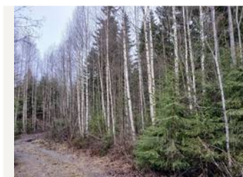
Näkymä käännympyrästä kuviolle 1