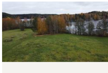
Kivitasku ja Punahilkka, näkymä Joenniementieltä päin