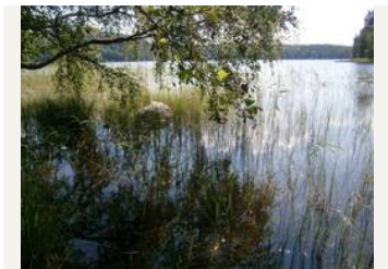
Kesäistä rantamaisemaa Vuollekeskiselle (kuvattu Punahilkkan rannasta)