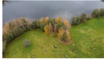
Kivitasku ja Punahilkka ylhäältä päin kuvattuna