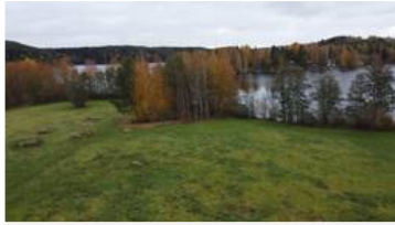
Kivitasku ja Punahilkka, näkymä Joenientieltä katsottuna