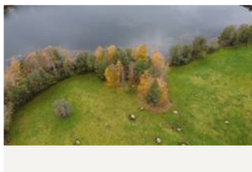
Kivitasku ja Punahilkka, ylhäältä kuvattuna