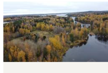
Oikealla kuvassa Kukkienvirta, joka yhdistää Vuollekeskisen Kukkiiaan, taustalla ylhäällä näkyy Kukki