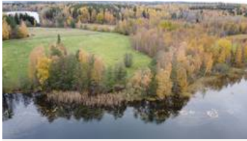
Kivitasku ja Punahilkka, rantanäkymää