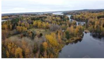
Kuvassa oikealla Kukkienvirta, joka yhdistää Vuollekeskisen Kukkiään, taustalla ylhäällä näkyy Kukkiä