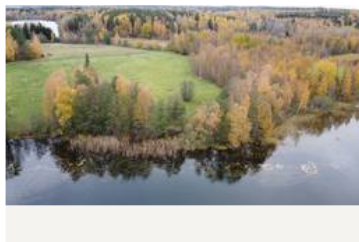
Kivitasku ja Punahilkka, rantanäkymä ylhäältä päin