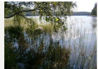
Punahilkkan kesäistä rantanäkymää Vuollekeskiselle