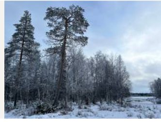
Kukkarokosken rantaa/kuvio 51