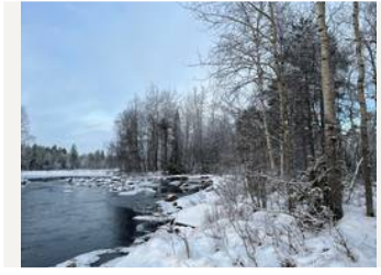
Kukkarokosken rantaa/kuvio 51