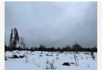
Kuvio 47 (Tuovivaara)